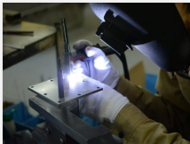
Reparatur von Geräten und Werkzeugen aus Edelstahl