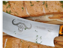
Instandsetzung und Schleifarbeiten von Messern