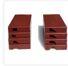
Schneideplatten aus Kunststoff