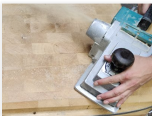
Instandsetzung und Abrichtung von Hackblöcken

Die Firma Beck bietet seit mehr als 20 Jahren einen umfangreichen Service im Bereich Instandsetzung, Wartung und Reparatur von Betriebsausrüstung an. Ein besonderer Schwerpunkt unserer Tätigkeit ist die hygienische Aufarbeitung von Arbeitsoberflächen bei Hackblöcken und Kunststoff-Schneideplatten. Dank moderner Technik in unseren Servicefahrzeugen werden die Arbeiten schnell, zuverlässig, sauber und termingerecht bei Ihnen vor Ort durchgeführt.