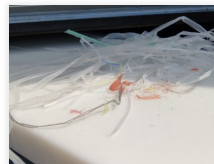
Oberflächenaufbereitung von Kunststoff- Schneideplatten