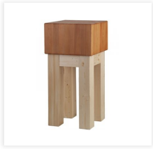
Hackblöcke und Zubehör